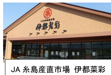
JA 糸島産直市場 伊都菜彩